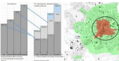
Diagram in karta iz parkirnih standardov mesta Örebro – klikni za večjo sliko

Gent je bil izbran za predstavitev celotnega sistema upravljanja parkiranja v mestu, ki je bil partner v projektu, vendar so tudi druga sodelujoča mesta uvedla pionirske ukrepe. Nekaj primerov je navedenih v nadaljevanju.