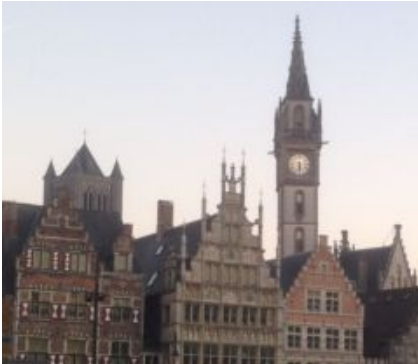
Gent (E: Ghent, F: Gand)