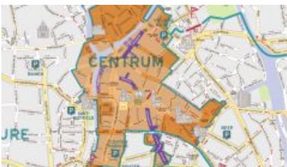
Izsek iz načrta za zmanjšanje tranzitnega prometa v mestu (v originalu Circulation plan) mesta Gent –

Gent (Nizozemska) vsekakor navdihuje s svojo lepoto, energijo, zgodovino in gostoljubnostjo, hkrati pa je vir navdiha tudi zato, ker je celovito in strateško upravljanje parkiranja premaknil na povsem novo raven. Leta 2012 je mestna uprava združila oddelka za upravljanje parkiranja in upravljanje mobilnosti ter ustanovila t.i. Podjetje za mobilnost (Mobiliteitsbedrijf). Novi direktor je uspešno integriral dve popolnoma različni stroki in v nekaj letih podvojil število zaposlenih (trenutno okoli 160). Podjetje je v 100 % lasti mesta in ima do mesta določene odgovornosti, hkrati pa lahko prosto razpolaga s svojimi sredstvi, katerih večji delež predstavljajo prav parkirnine. Tak ustroj ima več pomembnih prednosti: