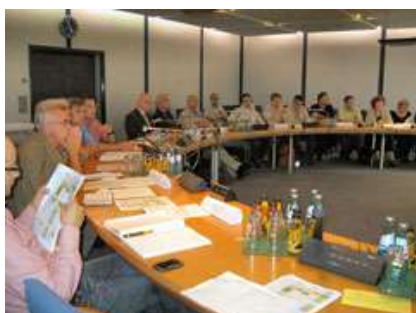
Round Table meeting in 2010 (Urban Planning Office)

V německých Drážďanech odstartoval proces vývoje „Dopravní plán vývoje 2025plus“ na podzim roku 2009. Od prvopočátku zahájil ústřední výbor plánovací proces pořádáním jednání u kulatého stolu. Byl veden nezávislým stavebním úřadem, jenž se skládá ze zástupců 46 organizací, profesionálních sdružení, hospodářské komory, lobbistů, městské správy a zástupců ze všech stran drážďanské městské rady. Byly vytvořeny 4 pracovní skupiny, se kterými členové kulatého stolu s podobnými názory a nápady spolupracovali: