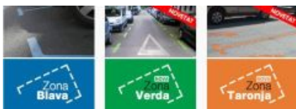
Le nuove tariffe e zone per la sosta a Tarragona

Abbiamo presentato Gent per mostrare almeno un quadro completo di politiche Push&Pull, ma anche le altre città hanno implementato delle misure pionieristiche. Ecco alcuni esempi: