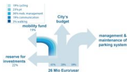
Uso dei ricavi da sosta a Gent nel 2015 (Clicca sull'immagine per ingrandirla)

Tutte le città sono partite da sistemi di piccole dimensioni. Le città nelle quali la gestione dei parcheggi è presente da un decennio o più hanno migliorato ed esteso la regolamentazione della sosta e la utilizzano sempre più come uno strumento strategico di gestione della mobilità. Come buon esempio si veda lo sviluppo di Graz , in Austria, dal 1979 a oggi.