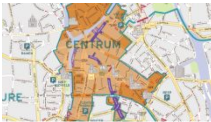
Un dettaglio del Circulation plan – clicca per scaricare il piano completo

Gent è una fonte di ispirazione perché è sicuramente una bella città, piena di energia e di storia, ed è molto ospitale, ma anche perché innanzitutto ha recepito benissimo tutte le raccomandazioni di cui sopra e poi anche perché ha portato l'integrazione strategica della gestione dei parcheggi a un livello superiore: nel 2012 ha unificato l'azienda che gestiva i parcheggi e il dipartimento comunale della mobilità nell' Azienda della Mobilità (Mobiliteitsbedrijf). Il nuovo direttore, un consulente esterno, ha dovuto integrare due diverse culture aziendali e ha raddoppiato il numero di impiegati (160 a oggi). L'azienda è di proprietà del Comune al 100%, ma è autonoma avendo un suo budget, in gran parte derivante dai ricavi della sosta. Tutto ciò porta ad avere grandi vantaggi: