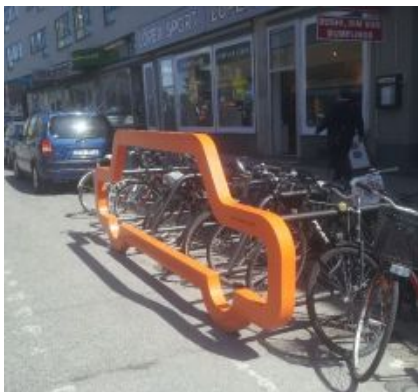
Parcheggio convertito a Örebro, Svezia

Una buona gestione dei parcheggi ha dimostrato di poter rappresentare un cambio di passo per le città: libera spazio pubblico, supporta le attività locali, riduce i viaggi in auto e la ricerca di parcheggio, mentre aumenta le modalità di trasporto sostenibili, migliora l'accesso per il trasporto merci, genera ricavi, aumenta la sicurezza, supporta la pianificazione urbana e può rendere le città più belle. Si può ottenere tutto ciò a un costo relativamente basso, anzi si può anche ripagare da solo! D'altro canto, una cattiva gestione dei parcheggi può generare l'opposto, come uno spazio urbano disordinato, accesso ridotto ai mezzi sostenibili, minore sicurezza e una struttura della città basata molto sull'auto.